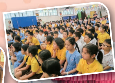
導師小組到校舉行「樂韻播萬千」中樂音樂會，擴闊同學的音樂視野。