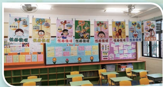
張貼正向語言海報於課室，讓老師多運用，同學多接觸。

最後，我們設計及訂製正向貼紙，供老師批改功課時使用。此外，在課室內展示六種美德之「八個性格強項公仔」及張貼正向語言海報 (welluse、overuse、underuse)，讓老師多運用正向語言於課堂管理，同學亦多接觸，潛移默化，從而加強正向課室管理技巧。