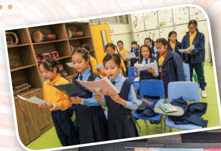
歌詠團表演《遵旨做工》，分享基督的大愛，表現獲得肯定，讓人鼓舞。

本校歌詠團聚集了一群熱愛唱歌的同學，並定期進行訓練，以提升歌唱技巧。本年度，歌詠團代表學校參加了「第三十四屆觀塘區聯校音樂匯演」，團員藉著歌曲《遵旨做工》，與人分享主耶穌基督的大愛，以鼓勵眾人以尊敬的心，齊來依靠上主。當天，歌詠團的表現獲得評判們的肯定，讓人相當鼓舞。此外，團員們亦能夠於匯演中觀摩他校的演出，互相學習，是一次很好的音樂交流機會。