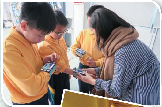
在進行比賽前，隊員們先在自己的設備內調整能量分配，包括：出球的速度、防護盾的硬度等，以便配合各人的攻守角色。

閃避球是不少學校體育課的常見活動，但「AR閃避球」分別在哪？有別於一般只對着電腦熒幕、單靠手掣操控的電競活動，「HADO AR閃避球」講求學生需於AR擴增場境中作大量的身體運動，這點與基顯STEAM教育中強調「動手做」的理念一脈相承。配合AR眼鏡和出球的手帶，同學以三人一組對戰，既要出防護盾防禦，又要伺機出波動球攻擊，中間更需配合能量守衡、團隊合作，短短三分鐘的賽事已足以讓學生們氣喘汗流！每場比賽後，體育科老師更能透過比賽過程的錄像片段及運動科學數據，向學生講解運動禮儀、動作、出球角度、團隊互助等技