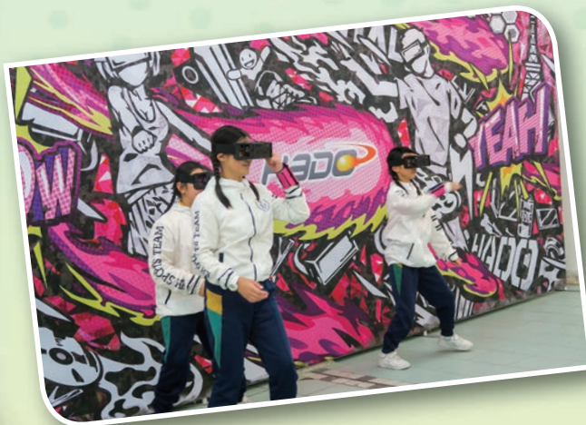
同學們以三人一隊作賽，講求運動神經的即時反應及團隊合作性。