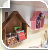
茶水間購備舒壓花茶