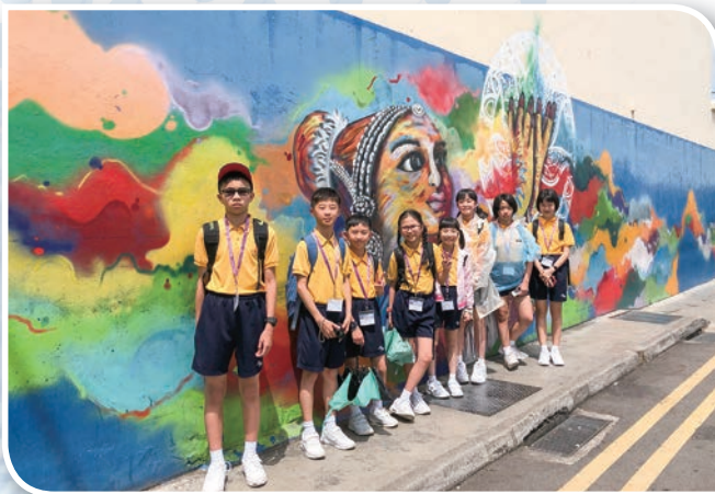
小印度充滿印度文化，同學在壁畫前拍照留念。

目不暇給。之後，同學們乘坐水陸兩棲鴨子船，在短短的一小時航程內飽覽新加坡的眾多標誌性建築。晚上同學們一同前往夜間野生動物園，在燈光柔弱的環境下，同學們帶著好奇和興奮的心情，乘坐觀光小火車在導遊講解下探索不同的野生動物。