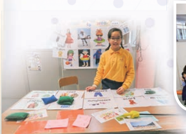
The English Ambassadors ran game booths for the students.

The joint effort of teachers and the enthusiastic involvement of students made our English Day terrific. We hope Kei Hin students could love English, enjoy English and explore English in their daily lives.