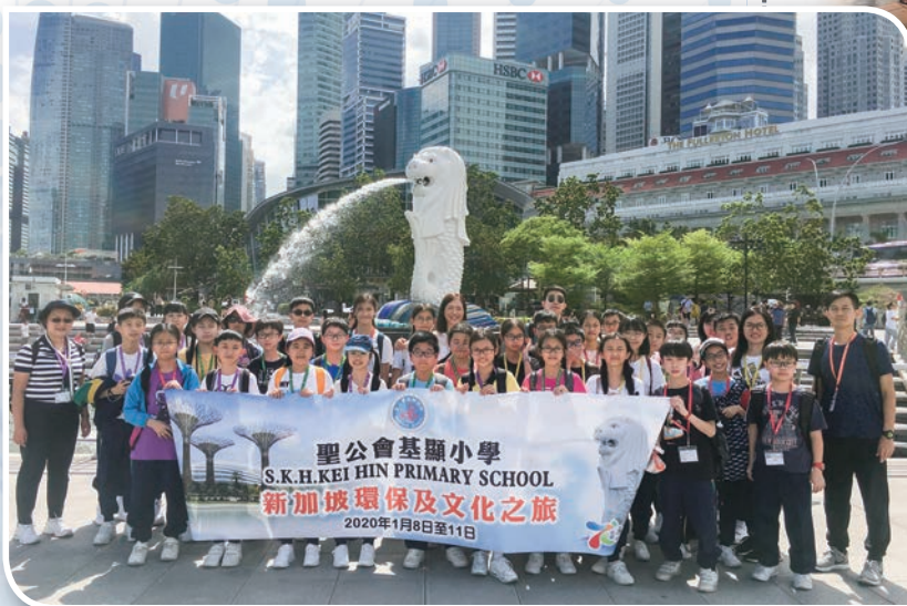
我們在象徵新加坡的魚尾獅像留影。

第一天，我們前往參觀了魚尾獅像公園、市政廳、萊佛士登陸地、克拉碼頭。同學們都在魚尾獅像擺出各種姿態拍攝留念。接著，我們到達新加坡的唐人街——牛車水，整個牛車水地區融合華人文化與延伸為新加坡式的人文風情，耳聞的對話多為中、英、粵語夾雜的內容，好讓同學們體驗新加坡的多元文化。沿途參觀時，同學們都買了不少紀念品和手信，收穫豐富。