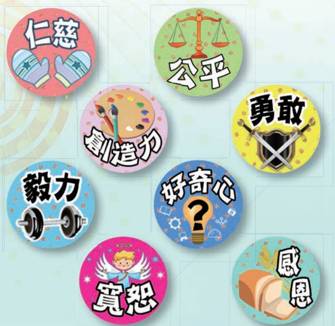
老師批改功課時可運用正向貼紙，加強學校正向氛圍。