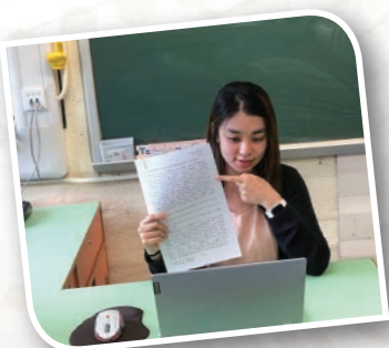
老師於實時視像會議平台與同學解釋小說文本，互動學習。

小學生能進行遙距學習，在網上平台中不斷學習新知識，家長們的努力與配合真的功不可沒。在此感謝家長的合作與支持，你們也辛苦了！願我們未來繼續攜手合作，一起培育孩子茁壯成長。