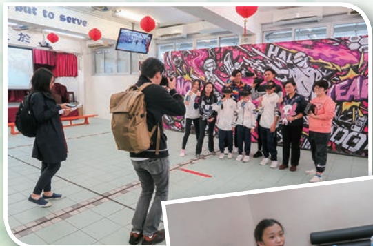
星島日報的記者為師生們拍攝大合照後，更和參與活動的同學做訪問。