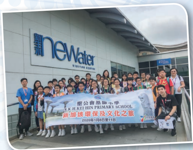
同學們親眼目睹新生水的生產過程及相關知識，學會珍惜水資源。

第三天，我們前往參觀新生水中心，同學們可以透過多感官的視聽感受及了解新生水的相關知識和研發過程，展覽中心裡還設置了一個新生水工廠，同學們可以親眼目睹整個生產過程。此外，同學還獲贈新生水，帶回香港品嚐。跟著同學們到濱海灣花園考察，同學們看到世界不同地區的植物，大家都嘆為觀止，最重要的是了解到環境保護的重要。最後我們到達濱海堤壩及永續展覽館參觀，認識新加坡在水資源可持續發展上的努力，讓同學們體會和反思不同的可持續發展模式。