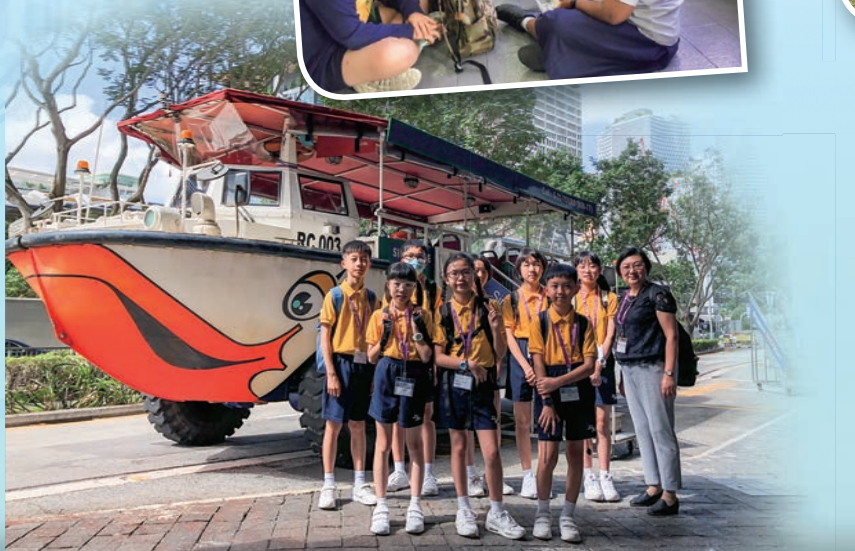
同學們好期待能試坐水陸兩棲鴨子船呢!