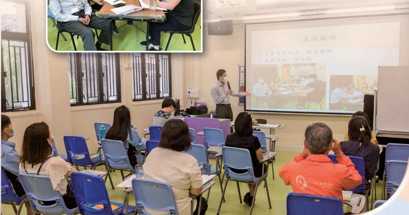
陳博士向數學組老師分享教學設計心得。