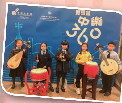
同學們欣賞「中樂導賞音樂會」，體會當中的韻味。

另老師帶領同學們到荃灣大會堂欣賞由香港中樂團及賽馬會合辦的「中樂導賞音樂會」。學生能親身體驗備有專業導賞的大型中樂團演出，學習觀賞音樂會的禮儀。同時，司儀亦為學生解讀各音樂選段的文化背景及內容，讓大家更能體會當中的韻味。