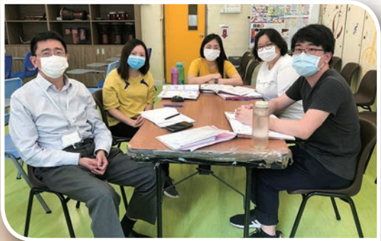
陳博士與數學老師共同備課。

除了重點發展五年級數學單元教學設計外，陳博士亦於本年度稍後時間到校進行講座——「校本支援計劃總結會」，與全體數學科老師分享經驗，促進老師們的交流，提升教學效能。