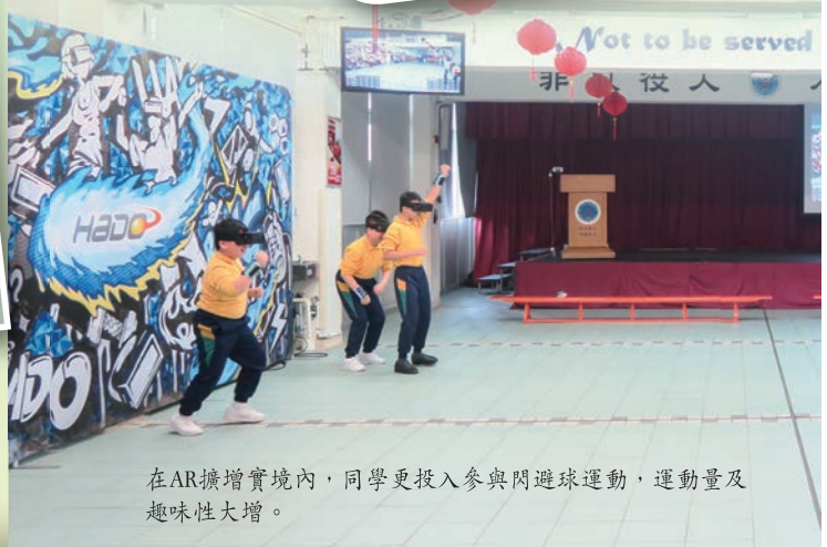
在AR擴增實境內，同學更投入參與閃避球運動，運動量及趣味性大增。