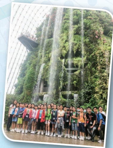
濱海灣花園的室內瀑布，讓同學有李白詩句中「飛流直下三千尺」的澎湃感覺。