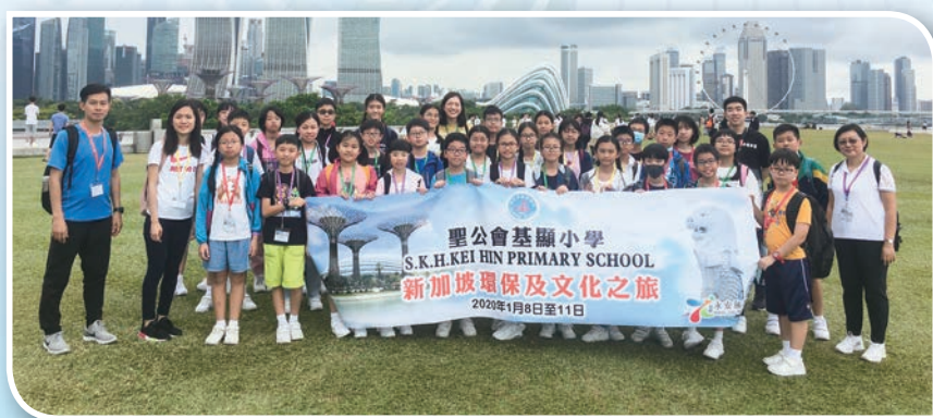
同學們於濱海堤壩可以飽覽海灣風景及不同的著名地標建築。

第四天，我們參加新加坡科學館DNA工作坊，在導師的指導下，大家穿起實驗袍，成為一位小小科學家，認真地學習提取小麥的DNA和即場製作DNA模型，藉此提升學生對STEM學習的興趣，擴闊視野，獲益良多！