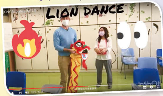
由外籍英語老師錄製新年英語短片，並配合英語遊戲。 低年級短片： https://www.youtube.com/watch?v=FyXvOgq91TM 高年級短片： https://www.youtube.com/watch?v=eqqmSRRdE_Y&feature=youtu.be