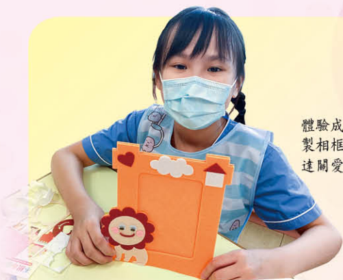
體驗成長課中讓學生自製相框，送予老人，表達關愛。

再者，我們亦重點進行教師及家長培訓，讓所有的施教者都學習「正向教育」的知識和技能。老師們分別進修了「正向班級經營」和「疫情下學生成長挑戰與心理需要」，並透過全體的「正向讀書會」交流彼此閱讀和體驗心得。而因應疫情關係，所有家長講座及工作坊均改以視像舉行，以「正向管教」、「理解孩子性格強項」、「培育孩子的成長性思維」及「提升孩子的正面情緒」等與家長分享心得。