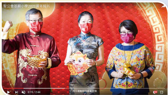
基顯小學全人同唱新年詩歌《祝福您》，為家長和學生送上賀年祝福。 短片： https://www.youtube.com/watch?v=foiokuBm1Lc&feature=youtu.be

為了讓同學「懂得欣賞」中華文化的藝術，中文科老師鼓勵同學製作創意揮春，並於「中華服飾日」當天運用自製揮春，互相祝福。外籍英語老師錄製新年英語短片教授新年習俗，並配合英語遊戲。音樂科舉行賀年歌曲歌唱活動，藉以讓學生有表演的機會，並學習欣賞同學的作品。視藝科老師教授同學新年摺紙藝術。