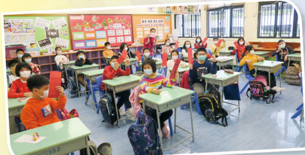
中文科老師鼓勵同學製作創意揮春，並於「中華服飾日」當天利用自製揮春，互相祝福。