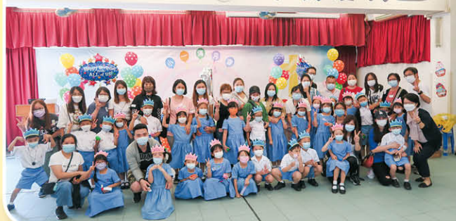
全體大合照 最後，家長、學生及老師一起拍攝大合照。活動在各人的歡笑聲中完滿結束。