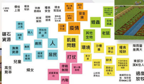
同學分析葉門所面對的困難以尋求解決方法。