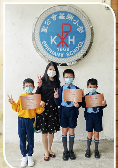
四年級泰國國際數學競賽 (香港賽區 初賽)銅獎