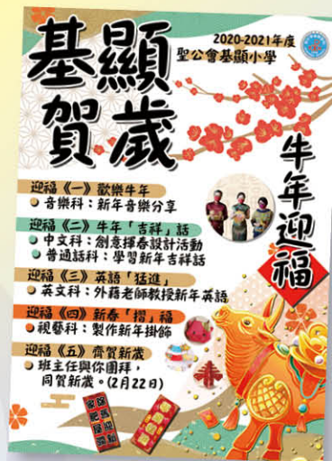
各科進行了一連串新年活動。