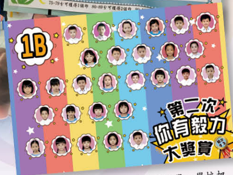
為表揚「毅力大獎賞」獲獎的同學，學校把獲獎者的照片展示於課室門外。