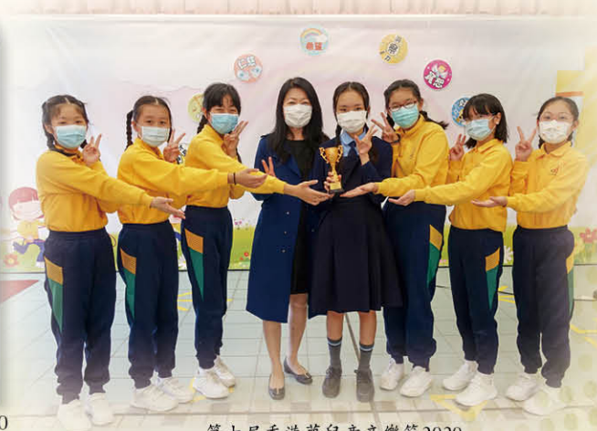
第十屆香港夢兒童音樂節2020 小組合唱~高小組~優異獎