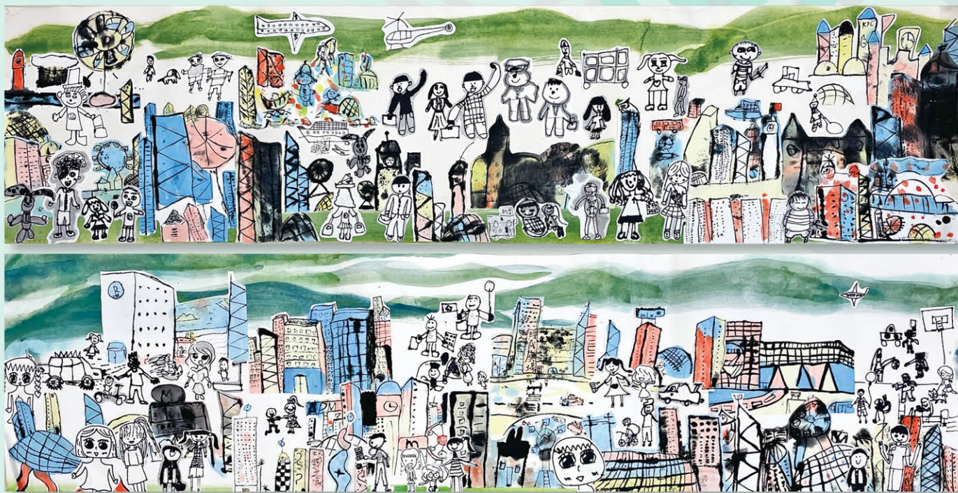
班級合作畫《我們的獨特城市》

是次計劃裏，我們能見到同學對創作媒介和方式都感到新鮮和興趣。藝術源於自然和生活，期望同學在參與計劃後能繼續觀察身邊的事物，擴闊屬於自己的小宇宙。