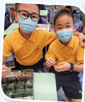
為找到合適的零件進行創作而興奮

除了培養學生的技能及思維的發展外，學校同樣重視對他們的品德的培養。此活動不但能秉承基督的關愛精神，亦能實踐校訓「非以役人，乃役於人」。從服務家人開始，培養學生以服務他人為己任，重視別人的需要及想法，達到STEM教學中以人為本的理念。