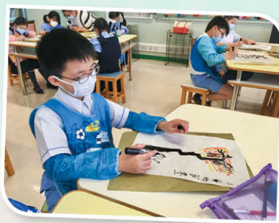
同學以麥克筆繪畫公園遊人。