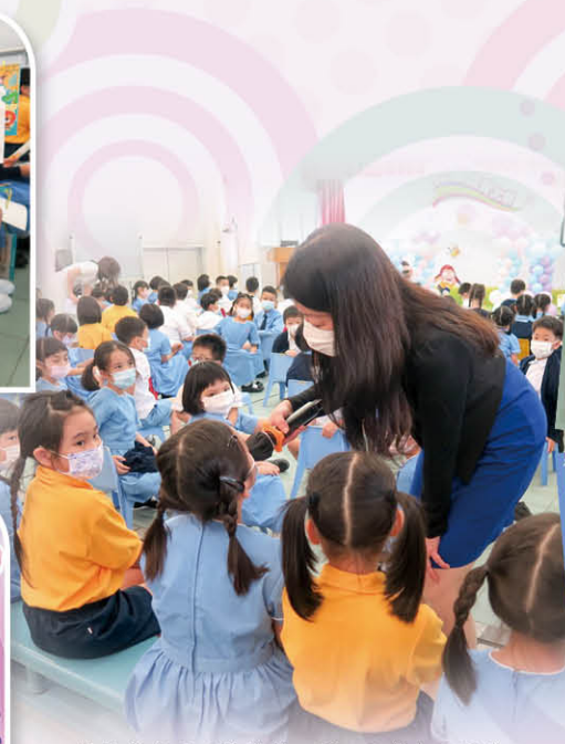
鍾校長訪問同學獲獎心得，同學表示因為她時常溫習，所以能獲得好成績。