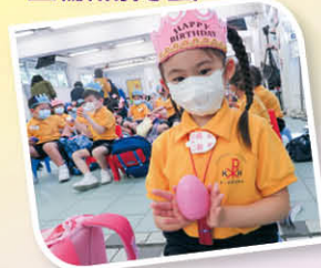
同學高興獲得一隻滿月蛋，內裏藏有一張寫著「天父賜福給你成為一位勇敢、忠信、喜樂的基顯人」的金句咭。