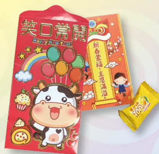
倫宗科老師於新年假前一星期的倫宗課內解釋祝福語。(祝福語是「新春蒙福，主恩滿溢。」)