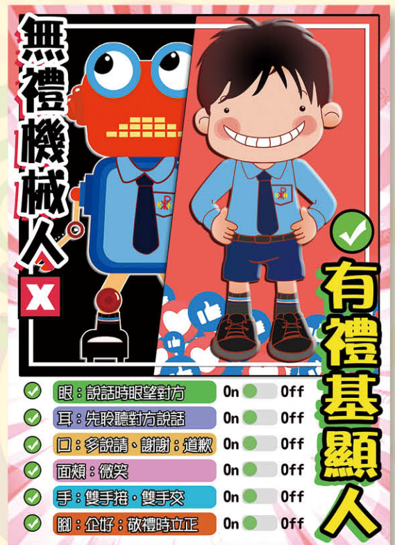
「有禮基顯人」海報讓學生清晰知道如何做到有禮的準則。