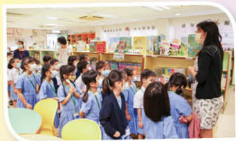
小一新生與老師同遊校園