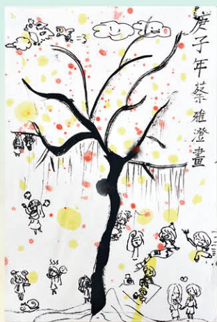
學生作品《公園一角》