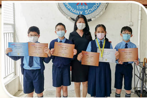
五年級泰國國際數學競賽 (香港賽區 初賽)銅獎 五年級泰國國際數學競賽 (香港賽區 晉級賽) 銀獎及優異獎