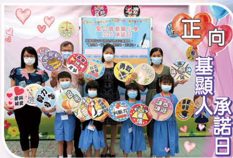
同學們於「正向基顯人——我的承諾日」活動中承諾成為一個有毅力的基顯人。