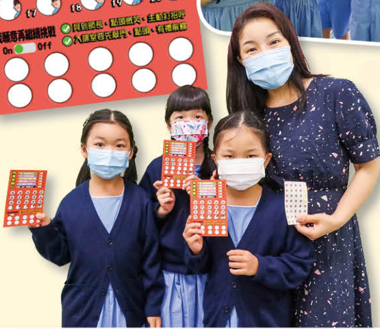
同學積極投入活動，獲得老師的貼紙獎勵。