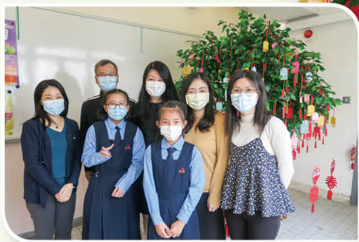
同學們積極參與祈願活動。