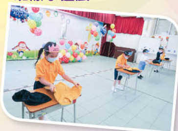
同學一起參與摺校服、砌校徽和有關學校設施的班際小遊戲。