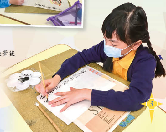
同學學習握筆後練習題字。