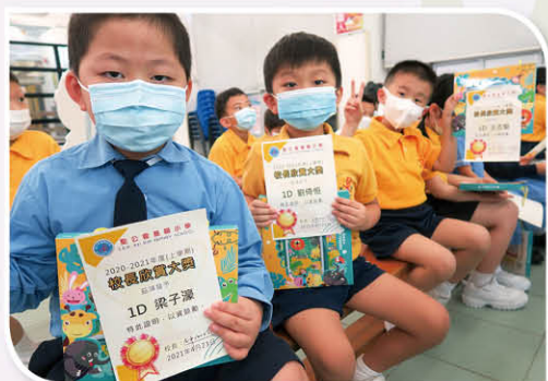
上學期進評中，每班一年級答對題數最多的10位同學獲得「校長欣賞大獎」。

另外，為了激勵同學們努力完成每一次進展性評估，並爭取好成績，本年度學校亦設立了「學業成績」獎，給進評整體成績良好的同學頒發獎項。為了隆重表彰同學們於學術上的成就，本校舉行了「校長欣賞大獎」頒獎典禮。典禮當日，獲獎的同學分享了考取好成績的心得，他們都表示自己會定立時間表，保持自律並每日抽時間溫習。在典禮上，鍾校長勉勵各級同學努力學習，為自己的未來打拼，期望越來越多同學能取得好成績。