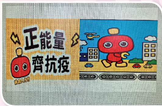
成長課中班主任教授「正能量齊抗疫」，並讓學生互相交流，齊心抗疫。