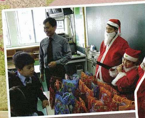
聖誕老人為我們預備的禮物真豐富！