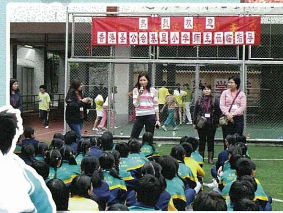
榮幸！真榮幸！我們可到越秀區少年兒童體校作交流學習。