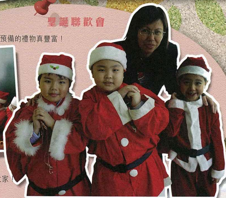
小小聖誕老人準備派禮物給大家！