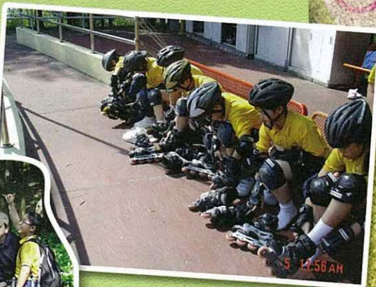
五年級的健兒們準備好了嗎？