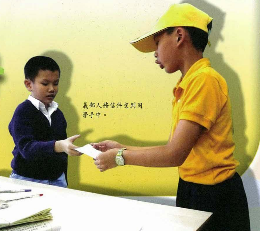
義郵人將信件交到同學手中。