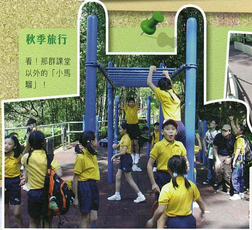
看！那群課堂以外的「小馬騮」！