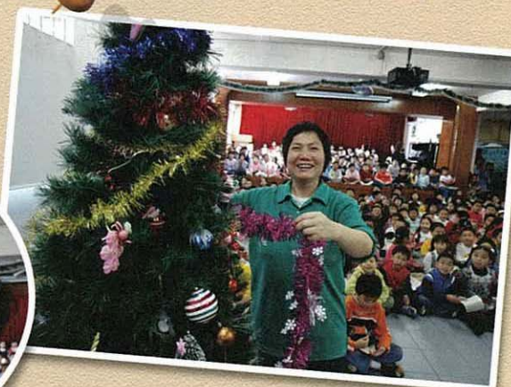
「請等等，我也來一起佈置。」麗姐笑道。