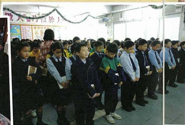
主在聖殿中，我們都肅靜。