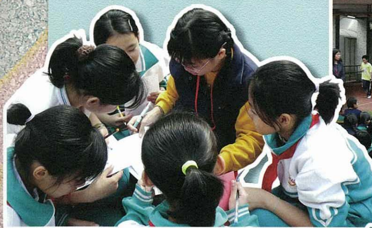
來·來·來，我們一同合作學習吧！