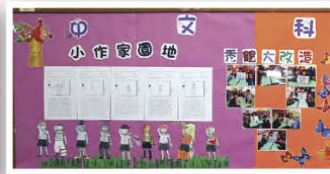
學生作品——《秃鹤大改造》