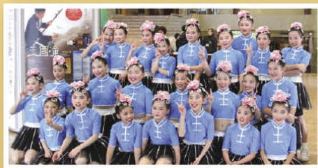
演出成功，來個大合照

本年度校隊以苗族舞「魚兒樂」參加了第四十九屆校際舞蹈節，並獲得甲級獎，成績優異。校隊同學除了每週接受兩次訓練外，比賽前更要加時排練，縱使付出許多時間和汗水，但緣於同學們對舞蹈的熱愛，大家都沒有埋怨，真是值得嘉許。