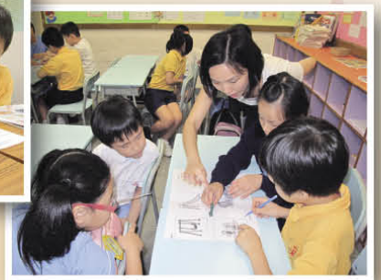
老師指導同學進行分組活動