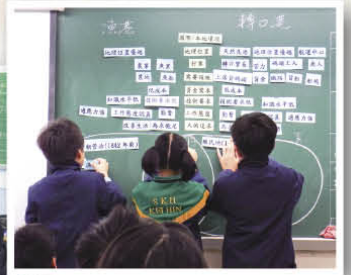
本校五年級學生進行資優教育學習