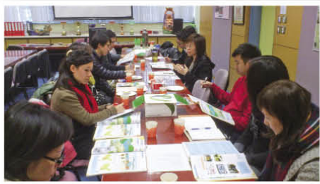
五年級老師與教育局資優組課程發展主任及友校老師開會，商討教學計劃

透過此計劃，我們期望學生的常識科學習變得更充實、主動及有意義，更希望學生能在其他科目，甚至是日常生活中學以致用，成為一個有思考、有主見的人。