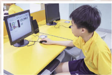
小记者製作「詩中尋樂」影片

相信通過學習和背誦古詩，同學更能吸收優美古詩的精華，擴闊語文知識，變成自身的文化遺產！