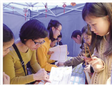
Miss Cheung and our students were keen on promoting the maxim game.