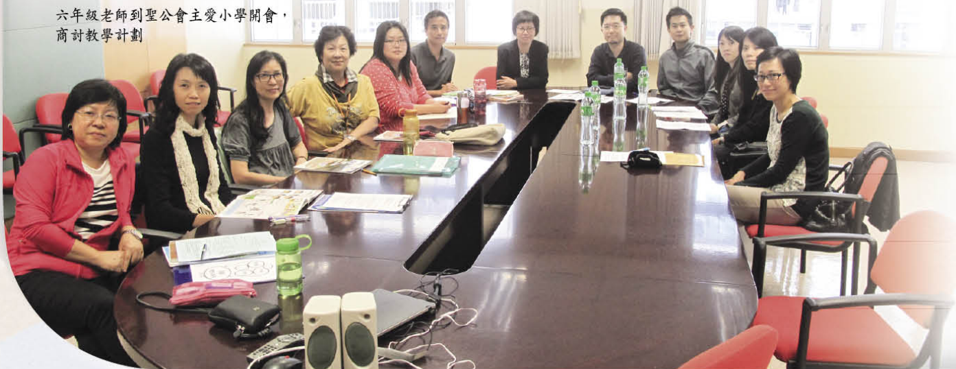
六年級老師到聖公會主愛小學開會，商討教學計劃