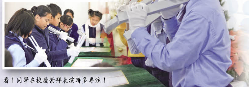
看！同學在校慶崇拜表演時多專注！