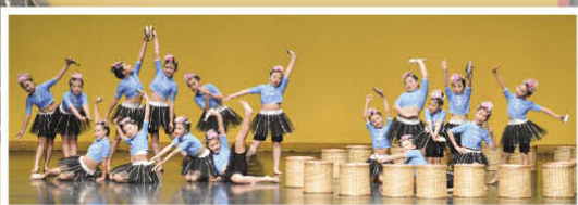
漁獲豐收，姑娘們多高興