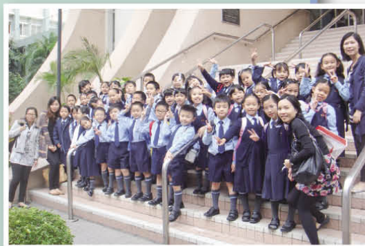
The parents are very helpful. They helped a lot on the competition day.