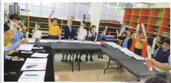
手鐘隊的同學在訓練時發揮合作精神

經過一學年的集訓，在導師和老師的悉心指導下，手鐘隊成員的節奏感明顯加強了，每次演出均十分出色。當他們奏出悠揚動聽的音樂，相信令不少同學都陶醉在夢幻的音樂世界呢！