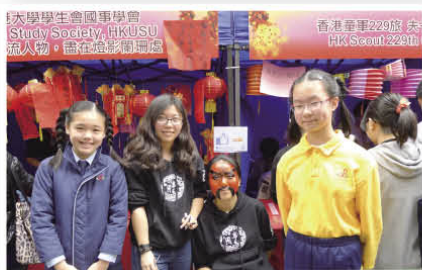
Our students were being the little reporters to interview participants of HKU.

We all enjoyed the day! It is good for our students to explore more of their talents and broaden their horizons by joining this outstanding event!