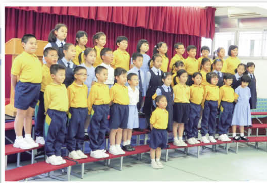
Students were having training in the school hall.

This year, our choral speaking team joined the 64th Hong Kong School Speech Festival. We entered the competition on 20th November, 2012. We performed very well on that day. We also got merit in this competition! It was a precious experience and a big encouragement to our team.