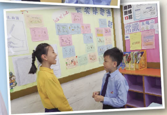
他們正在教室背誦格言呢！