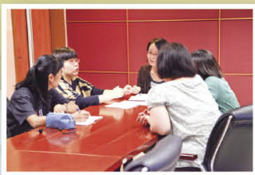
一年級數學老師與吳丹老師進行教學檢討

首先，我們在上學期以簡單的加、減法應用題以及「A比B多/少」文字題(18以內的數)為教學試點，教授學生運用圖像思考方法把簡單的應用題具體化，同學會運用畫圈的方法解應用題。例子如下：