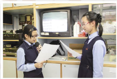
文學大使於午膳時段主播「詩中尋樂」活動