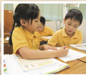
二人一起討論，你幫我，我幫你