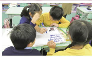
如何形容這個肖像好呢?