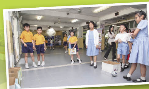
Let's play Wordball Game!