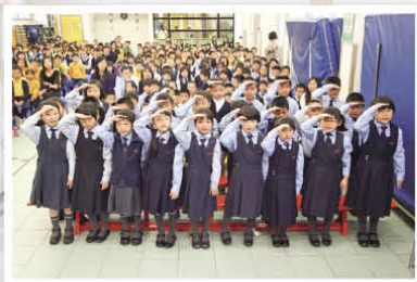
跨級古詩集誦比賽