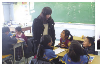
五年級老師到友校觀課，並與學生交流