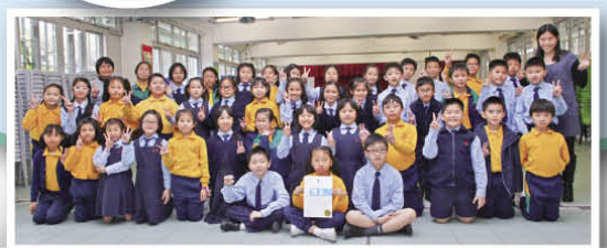
分享成果一刻，大家心中充滿喜悅