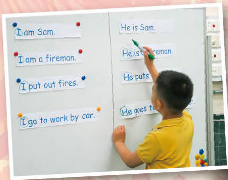
Pupils learnt writing skills in the lessons.