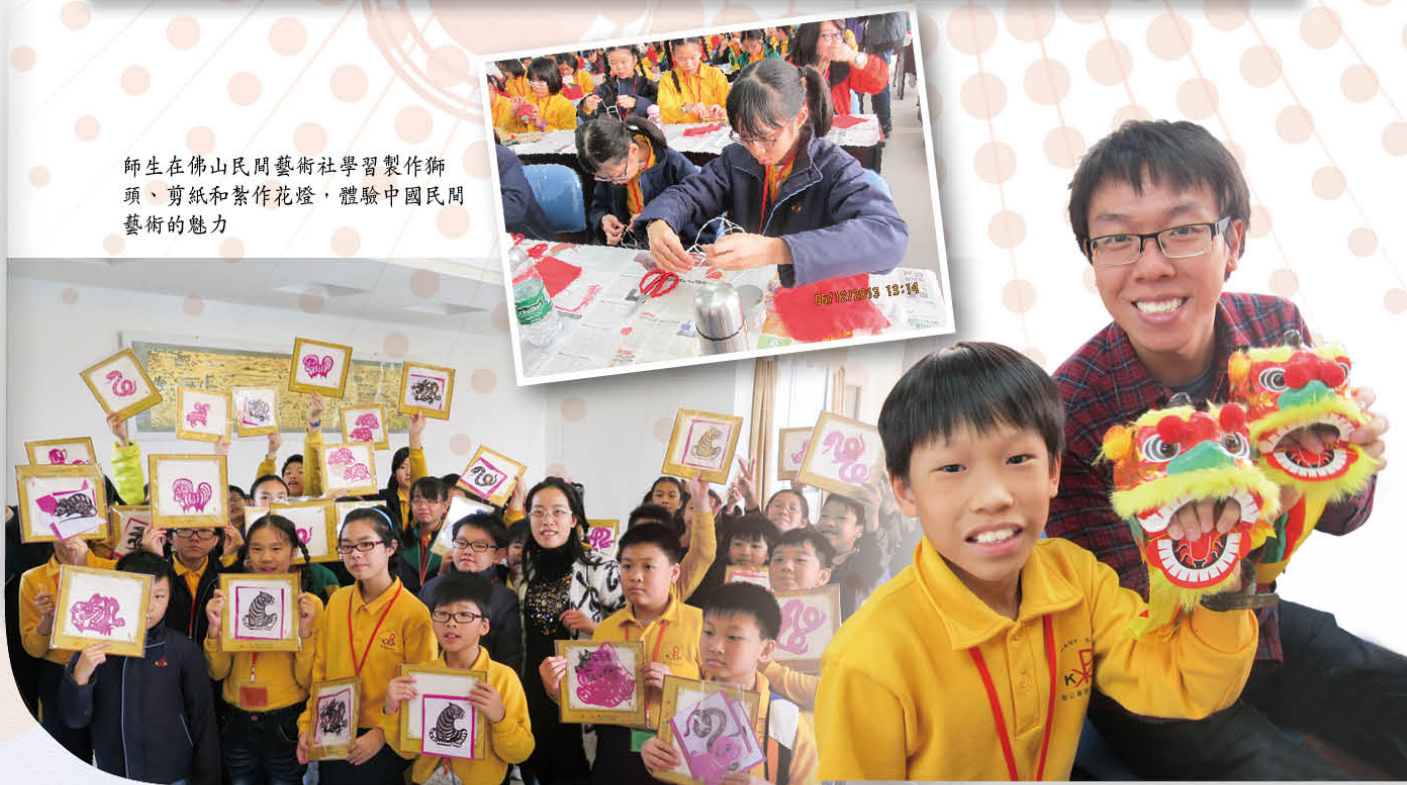
師生在佛山民間藝術社學習製作獅頭、剪紙和紮作花燈，體驗中國民間藝術的魅力