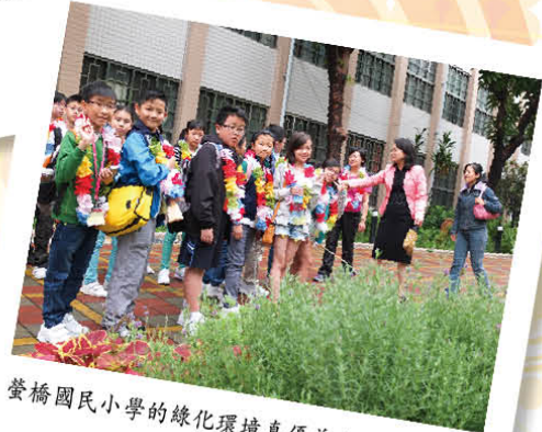
螢橋國民小學的綠化環境真優美！