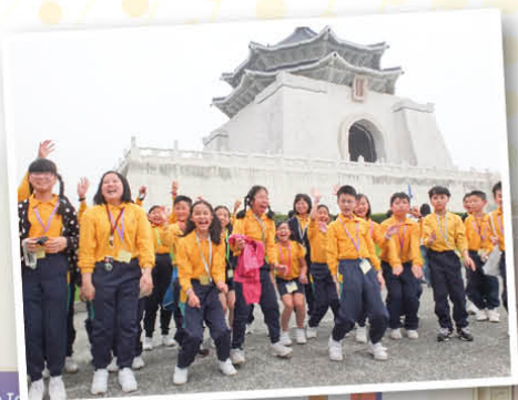
inland to T 産堂の対立が再盤

在文化學習方面，我們參觀了故宮博物院、中正紀念堂及台北探索館，讓我們對台灣的歷史有初步的了解。這次旅程雖然短暫，但對基顯的師生而言，實在是既充實又有意義的一課。