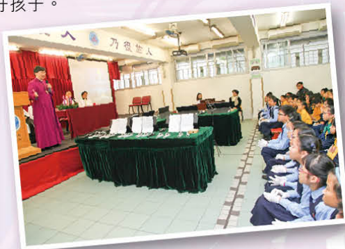
陳主教於講道中和同學分享顯現節的意義