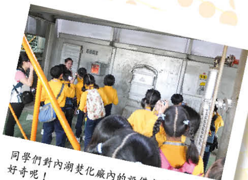
同學們對內湖焚化廠內的設備感到十分好奇呢！