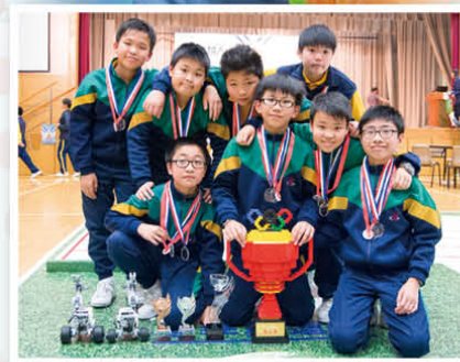
贏得份量十足的「基福盃」，隊員們都興奮莫名