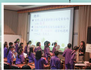
課堂教學是兩岸四地教育工作者難得的經驗分享