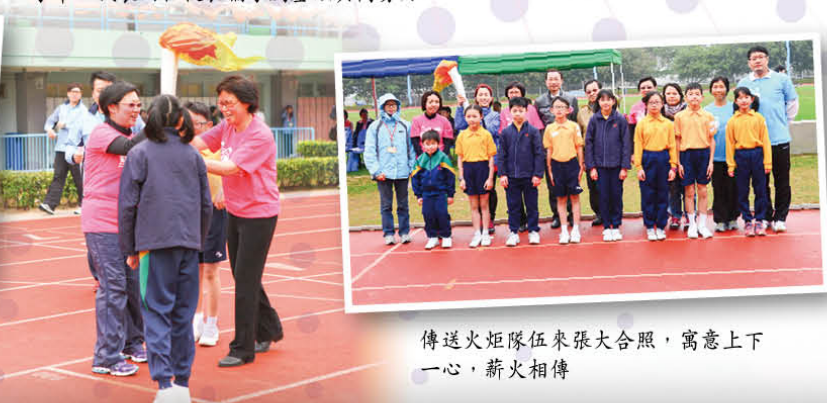
傳送火炬隊伍來張大合照，寓意上下一心，薪火相傳