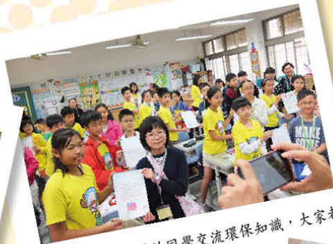
與興雅國民小學的同學交流環保知識，大家都獲益良多