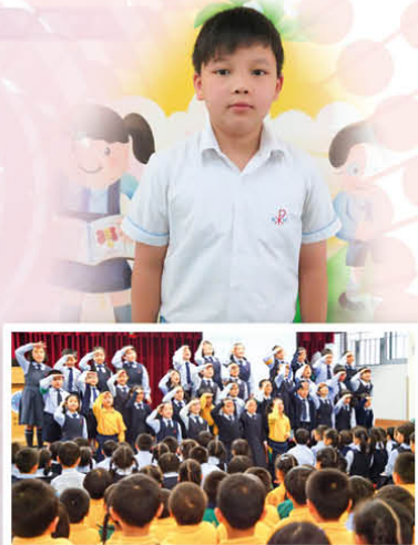
The Choral Speaking Team performing in the assembly.

We got second place in the 65th Hong Kong School Speech Festival. We all felt very happy. Our teachers gave us some pizza as an award. The pizza was delicious! I like eating pizza. I like choral speaking too.