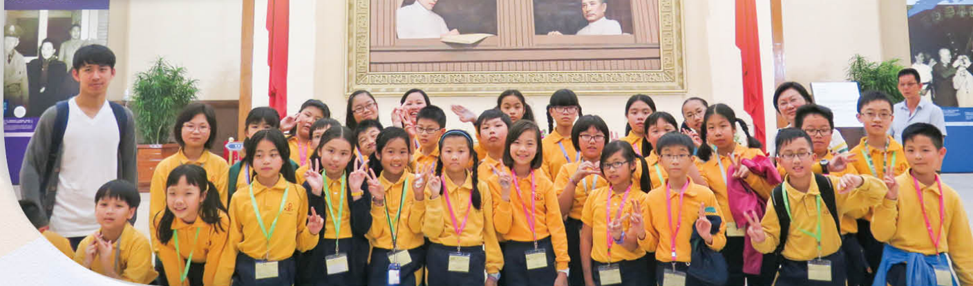
於中正紀念堂拍照留念，此行加深了我們對中華文化的認識