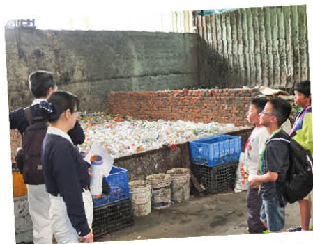
慈濟環保站的義工正在講解垃圾分類的處理步驟