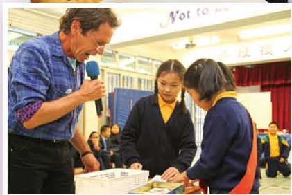
P.4 pupils had the 'Friday Shopping'.