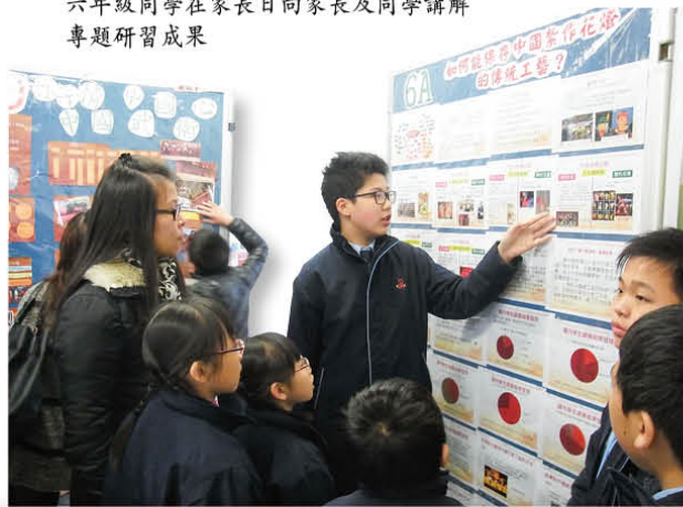
六年級同學在家長日向家長及同學講解專題研習成果