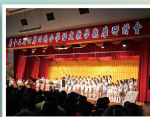
南大附小學生的精彩表演——台灣民謠組曲