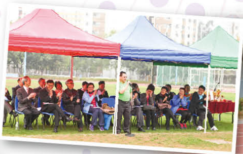
謝總幹事穿上校慶T恤，以「基顯人」的身份生動地演講，贏得一眾來賓熱烈的掌聲