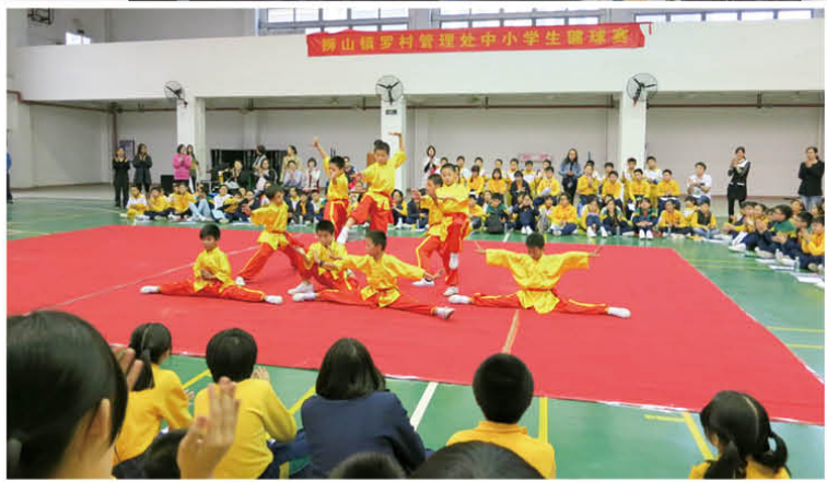
武術隊員年紀小小，已功架十足，真教人拍案叫絕！