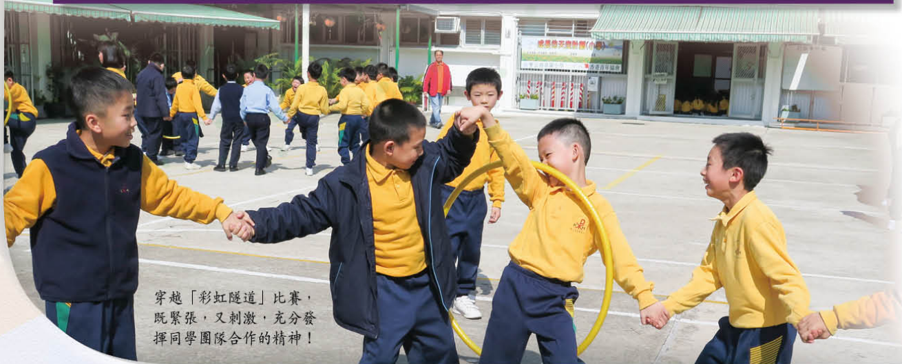
穿越「彩虹隧道」比賽，既緊張，又刺激，充分發揮同學團隊合作的精神！