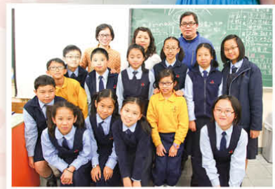
兩位文化地圖總監在「獨立電影評賞」活動中作示範教學