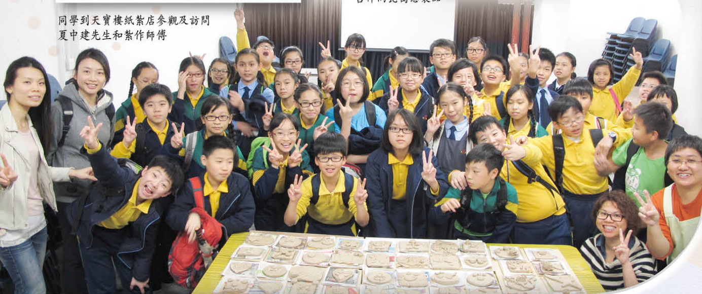
同學們在自得窯「陶藝製作」工作坊中，用心製作的吉祥陶瓷寓意製品