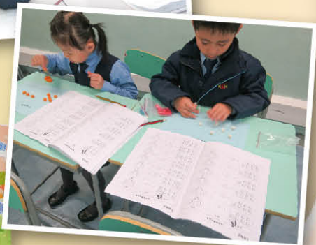
學生運用數粒學習10的組合