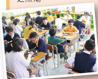
全班同學聚精會神地奕棋

「Abalone」中文名為大力士棋，是一種在歐洲國家流行的創新棋盤遊戲。透過奕棋遊戲，可以提升學生IQ、EQ、AQ以及立體思考，因此學校將於下學期的數學日中加入棋藝比賽，讓學生延續「棋」之熱潮。