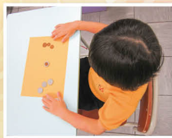
學生把錢幣用顏色來分類