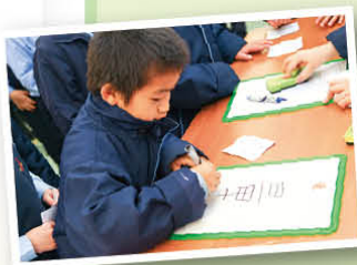
同學正參與「齊來寫寫字」攤位，按筆順正確地把「量」字寫出來

中文科將於下學期末舉辦第二次的中文日，內容為廣播劇及話劇比賽，藉以提升學生的說話及創意能力，多麼期待同學們的精彩表演呢！