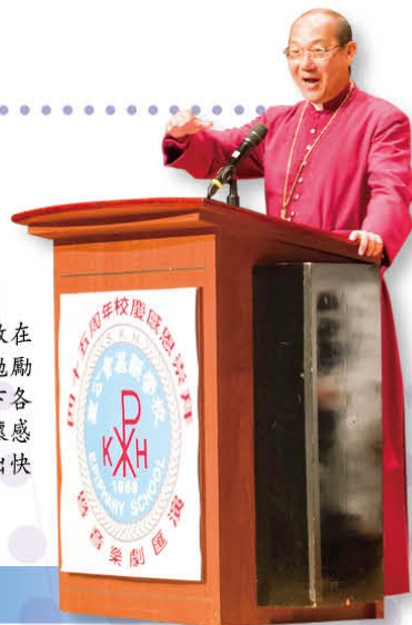
鄭大主教在講道中勉勵基顯上下各人，要常懷感恩，活出快樂人生