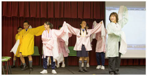
「小不點學專劇」工作坊，既充實，又有趣！

此外，本校全體常識科老師會從旁指導六年級各小組成員完成專題研習，使學生更能掌握專題研習技能，活用所學知識。本年度學校首度派出六組學生，參加由香港教育學院舉辦的「錦繡中華」專題研習報告比賽和「百年中國」廣播劇演繹比賽，在老師的悉心指導和組員的同心協力下，締結出美好的收成，共獲得一項亞軍、一項季軍、兩項金優和兩項優異的佳績。