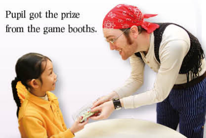
Pupil got the prize from the game booths.

We organised game booths for P.1 and P.2 pupils such as 'Treasure' and 'Walk the Plank'. Pupils revised the knowledge they learnt before from the game booths and they loved them very much. P.3 pupils had 'Running Dictation' while P.4 pupils had 'Friday Shopping'. Pupils enjoyed the games because they were competitive between the different classes in each year group. They felt excited and prizes were given to the winners. For P.5 and P.6 pupils, we provided 'Jeopardy' and 'Blockbusters' for them respectively. Pupils answered the questions by Mr Gary and Mr Overton. The winners of the games were awarded with prizes. To sum up, pupils participated actively in the games on English Day and we will keep on organising it in the coming years to arouse pupils' interest in learning English.