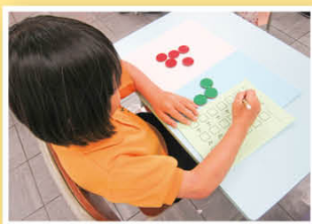
學生利用雙色籌碼教具學習8的組合與分解