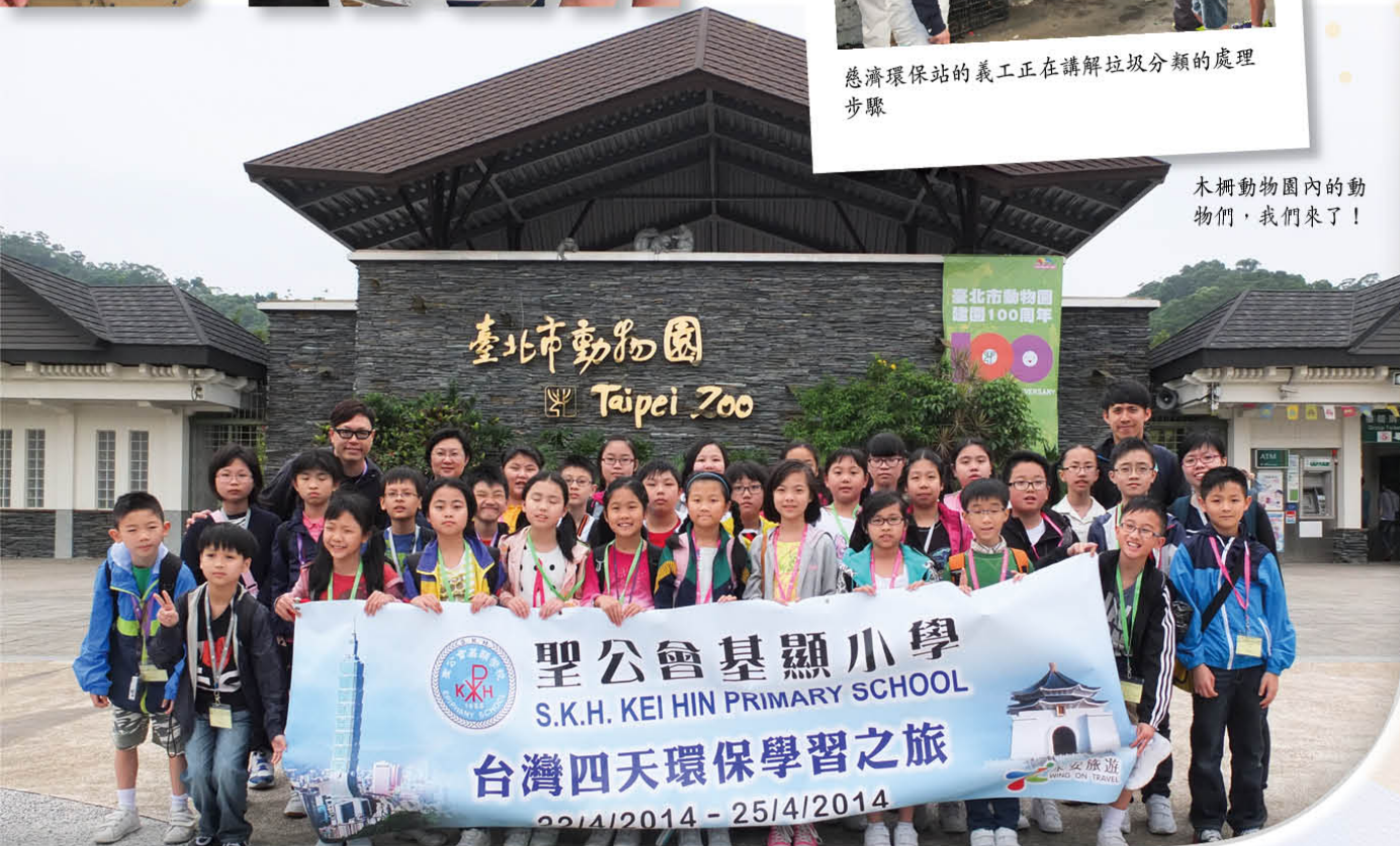
木柵動物園內的動物們，我們來了！