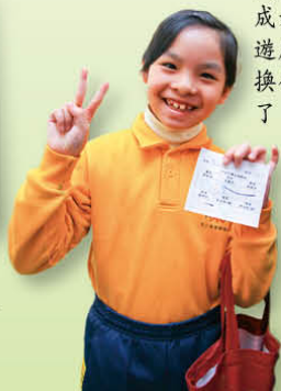
同學成功完成六個攤位遊戲，可以換領獎品了！