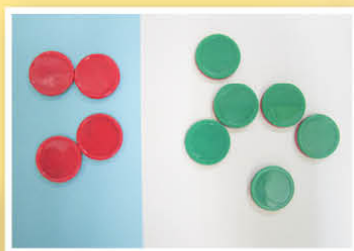
幼稚園教師利用雙面色的籌碼教授8的組合與分解，讓學生明白組合互補及互換的概念