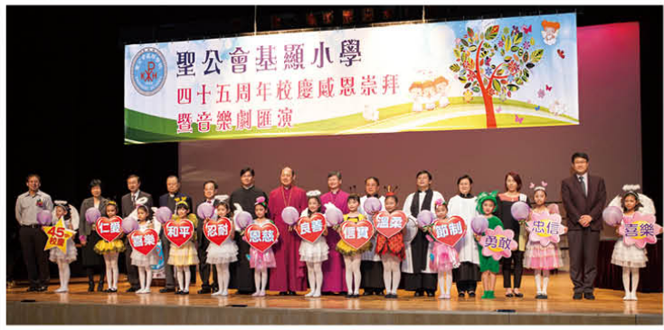
校慶揭幕禮以本校信條和聖靈果子作主軸，別具意義