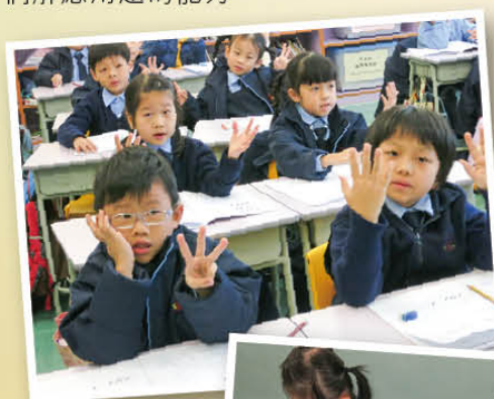
一年級學生運用「心、手、口」的方法找出加減法的答案

為達到課程架構上的一致性，並因應「數」範疇縱向及橫向的課程發展，一、二年級數學老師共同設計一套螺旋式的校本應用題審題及圖像思維解題策略課程，並編製了「應用題冊」。透過「應用題冊」的學習內容，建構學生理解應用題的習慣，學生從中掌握分析題意的重要性、找重要資料的策略和運用圖像思維解答應用題的方法，從而提升他們解應用題的能力。