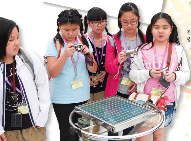
同學們對興雅國民小學的太陽能發電設備很感興趣