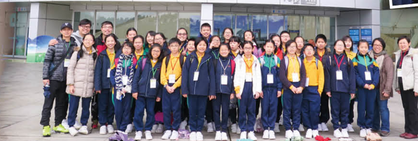
在廣東科學中心門前來張大合照