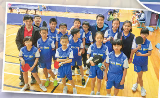
賽前大合照，大家都自信滿滿的！