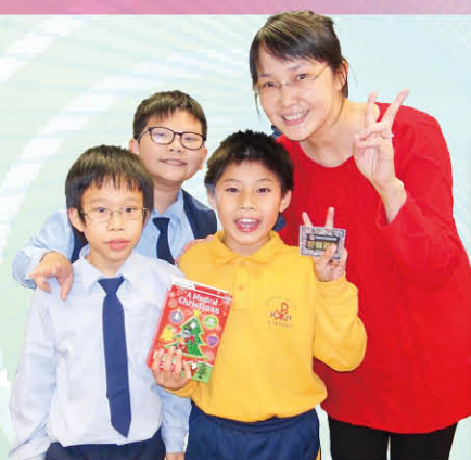
好書派對之抽獎送禮遊戲

好書派對為本年度新辦的閱讀活動，每兩個月舉行一次，邀請過去三個月首三十六名的最高借閱者參與，一起共進午餐，彼此了解閱讀喜好，還可以優先借閱新書，同學們都十分喜愛這活動。後來，又因應同學的要求，我們另辦了兩期「KISS KISS Books Party」，讓未能擠身最高借閱者名單內的同學都有機會來多接觸好書，多分享圖書。