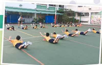
田徑校隊隊員在校內進行集訓

為了提升隊員的實力和表現，本年度的田徑訓練由校內走到校外，每星期隊員均會到九龍灣運動場或斧山道運動場接受專業教練的訓練。在持續性的訓練下，學生除了在運動表現得到提升外，團隊性及紀律性亦大大提高。希望在不久的將來，隊員可在比賽場上發揮所學，為基顯爭光。