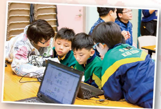
老師及同學們正商討如何編寫電腦程式