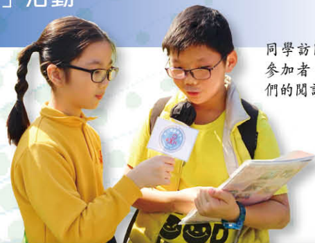
同學訪問場內的參加者，了解他們的閱讀喜好

活動結束，我們有幸獲得了小學組遊戲攤位之「最佳遊戲設計大獎」。期待下屆活動，我們繼續做好閱讀推廣的工作，讓更多的人認識書籍及閱讀所帶來的益處。