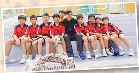
比賽開始前，穿上整齊球衣來張大合照