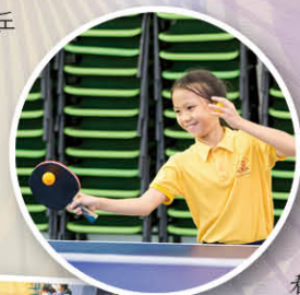
看我 們練球 時多快樂！

每年乒乓球隊皆會參加九龍東區學界乒乓球比賽及其他比賽，以豐富隊員們的學習經驗。本年度球隊派出男女子隊共四隊出賽，其中女子乙組再次打入八強，成績令人鼓舞！