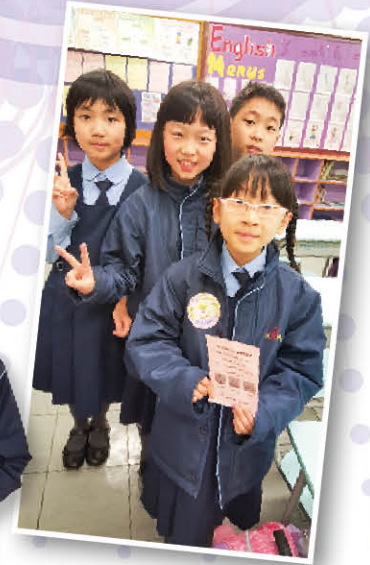
獲派生日貼紙的同學拿着食物券與同伴合照