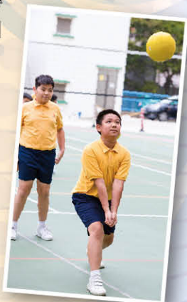
隊員平時訓練投入，希望動作做得標準

每年校隊同學均會參加九龍東區小學學界排球比賽，很高興本年度能夠進入八強階段，證明隊員付出的汗水及努力是沒有白費的！