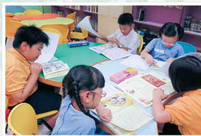
「從讀好書到寫好文」工作坊中，同學們正努力尋找資料創作故事

閱讀寫作工作坊是圖書館今年的重點發展項目，期望透過不同的閱寫學習活動，鞏固學生的語文基礎，提升閱讀興趣及寫作能力。工作坊內容如下：