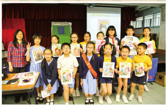
獲得親筆簽名海報的同學，與君比老師一起合照