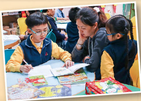
英文親子伴讀圖書，父母與子女樂在其中