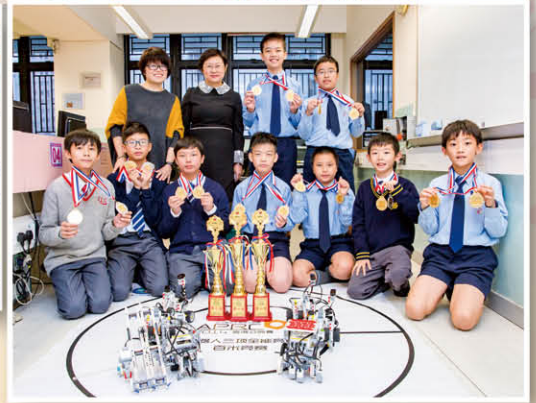
台灣一役，是基顯校隊的大豐收！