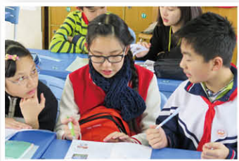
兩地學生互動交流