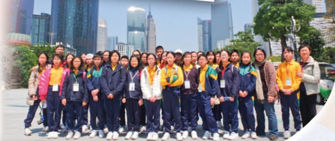
一起在花城廣場拍照留念，為這次境外學習劃上完美句號

廣東省博物館展示的月餅典故：中國人吃月餅取團圓之意，清末民初，廣州月餅就以選料上乘的特色而聞名