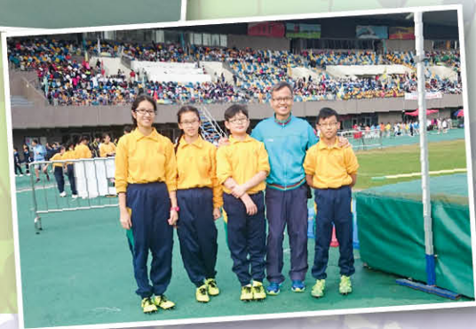
師生一起參加九龍東區小學校際田徑比賽