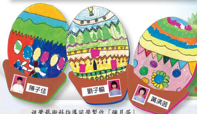
視覺藝術科指導同學製作「彌月蛋」