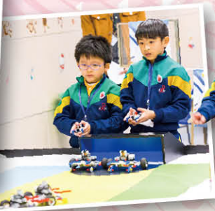
初小足球賽的隊員們正全神貫注比賽中