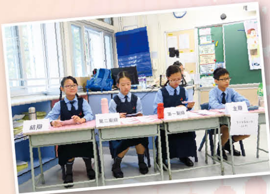
辯論隊同學正在進行辯論比賽，大家都很投入及認真，加油！