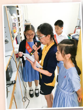
希望你们日後能成為出色的主播！