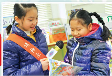
好書派對中，訪問同學的閱讀喜好