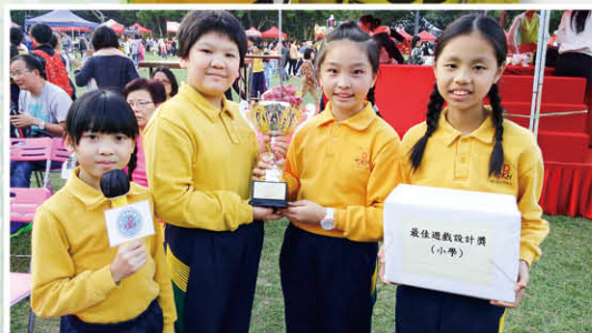
我們獲得了小學組的最佳遊戲設計大獎呢！