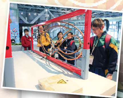
同學正在仔細觀察不同的展品，從中認識科學的原理

這趟旅程中，我最喜歡的是廣東科學中心裏的「模擬碰撞」、「模擬乒乓球」和「玩具車」實驗。我覺得「模擬碰撞」充滿真實的感覺，沒法用說話形容，一定要親身嘗試才能體會；「模擬乒乓球」和真人對打沒有兩樣；而駕駛「玩具車」讓我尋回童真。廣東科學中心真是一趟難忘的行程。