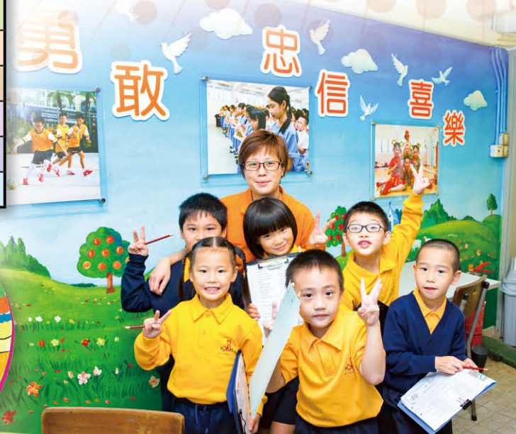
常識課安排全體一年級學生，分組訪問教職員，了解各人的工作