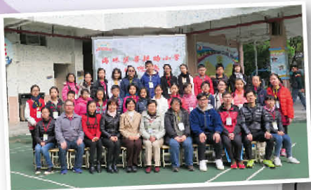
拜訪姊妹學校——廣州菩提路小學

下午，我們參觀了黃埔軍校。在軍校裏，我認識了很多為國捐軀的歷史名人，包括孫中山先生在內，他們的英勇事跡令我非常感動。這趟旅程使我十分難忘！