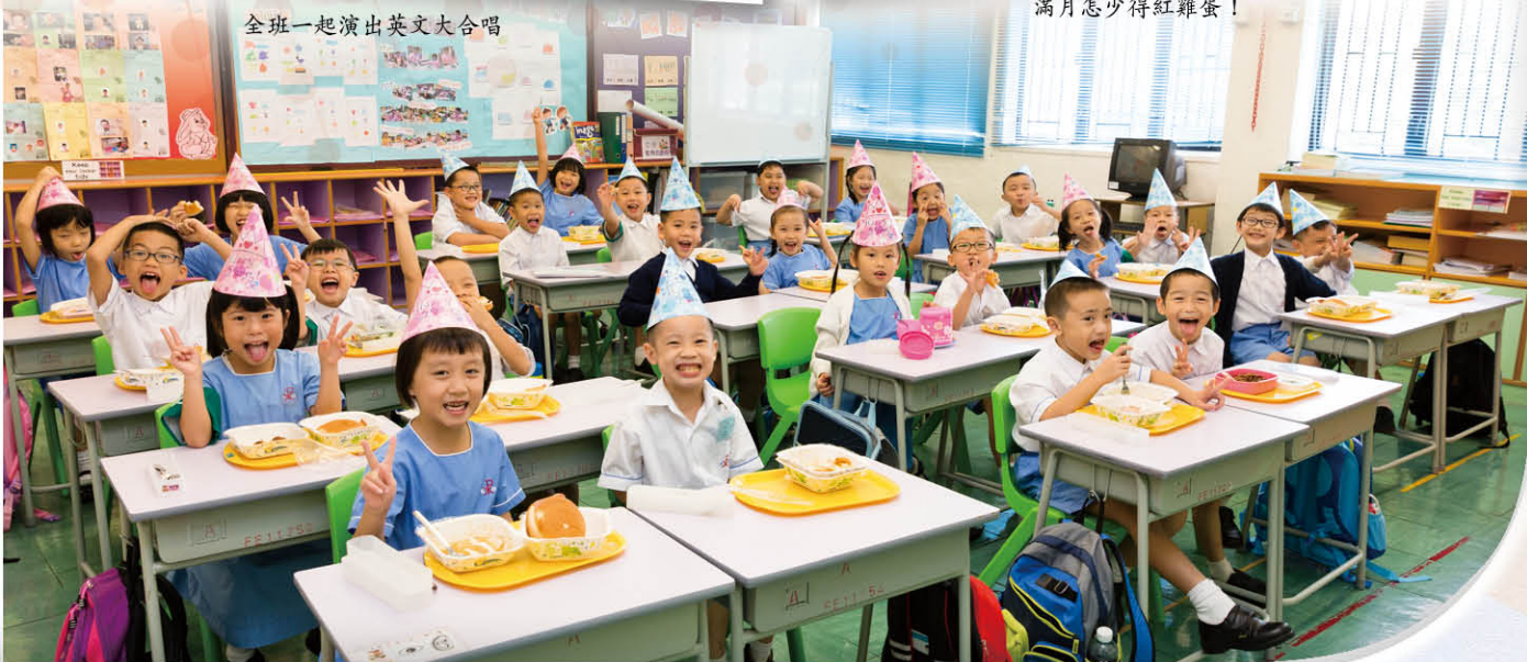
滿月會當天的午餐份外豐富！