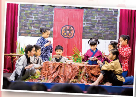
維肖維妙的造型，生鬼投入的演出，你們真是話劇組的精英！