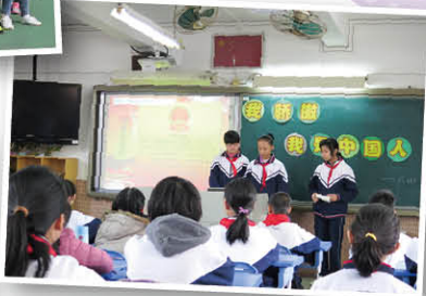
中港學生一同上課，讓基顯的同學體驗中港教育文化的差異