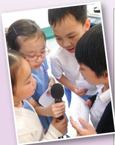
心晴特工隊隊員正為全校師生介紹《勵志歌曲集》中駱校長的歌點播歌曲

我們邀請老師結集心水的鼓勵歌曲，輯錄成《勵志歌曲送給你》歌集，讓心晴特工隊隊員於午膳時段點播，並於大氣電波中傳遞老師們的鼓勵話語。此外，同學們還可以利用手提電話或平板電腦的QR Code Apps，掃描歌曲檔案的QR Code，即使在家中也可欣賞老師的心意，延續師生間親密的感覺。