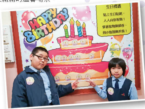
當天生日的同學，在HPBD2U壁報前留影