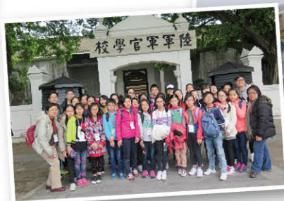
參觀廣州黃埔軍校，讓同學們認識軍校歷史