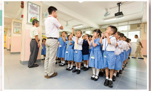
利用一致手號，訓練學生常規

為了讓小朋友熟悉基顯小學的學習環境，並進行常規訓練，學校於八月下旬安排了兩天的小一新生訓練日。在這兩天裏，學生不但認識了班主任老師，也跟同學們互相認識，很快便成為朋友，小學不再是個陌生的地方了。所以到了九月一日開學日，每位小一新生都帶着興奮愉快的心情回到學校，享受小學的學習生活。