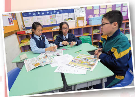
領袖生正在準備演說的資料，多認真呀！