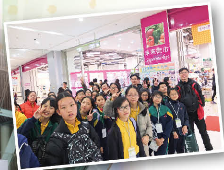
來到廣州的大型超市，親身體驗國內的民生情況

我們過關後，吃過午餐，再經過兩小時的車程後，便到達廣東科學中心。那裏有很多不同的展覽館，當中最吸引我的是交通資訊館裏的「經濟駕駛」，這個遊戲能讓參與者親身體驗駕駛的樂趣，真是十分好玩。我還在這裏認識到很多駕駛知識，十分實用呢！接着，我們去了市內超級市場進行購物任務，真的既緊張又刺激！今天令我大開眼界，有機會也要再來一趟。