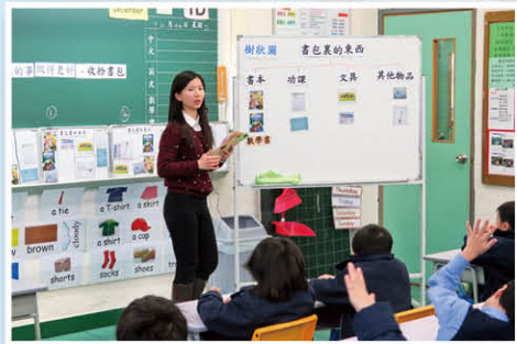
老師利用樹狀圖教學生如何將書包內的物品分類

第一層為全班式資優教學，透過教導學生不同的高階思維策略，提升學生高階思考能力，務求將資優教育普及化。多年來，本校參加了教育局資優教育組所舉辦的「資優教育教師網絡計劃」及「科學與科技探究教師網絡計劃」，亦參與資優教育社群網絡，互相分享及交流資優教育的成果。