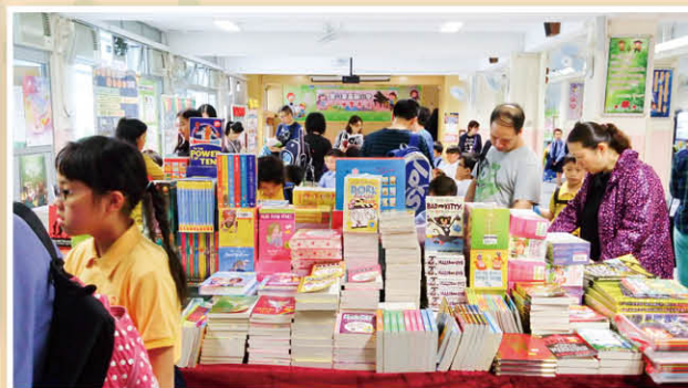
英文圖書展銷，同學和家長都踴躍選購